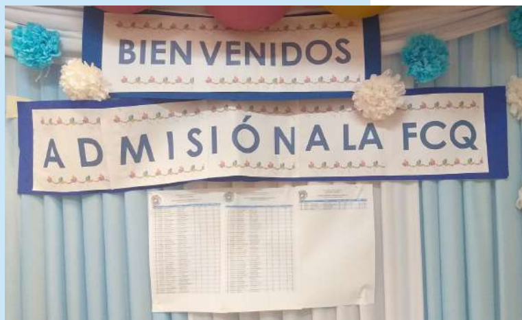
Listado final de ingresantes a la Facultad de Ciencias Químicas