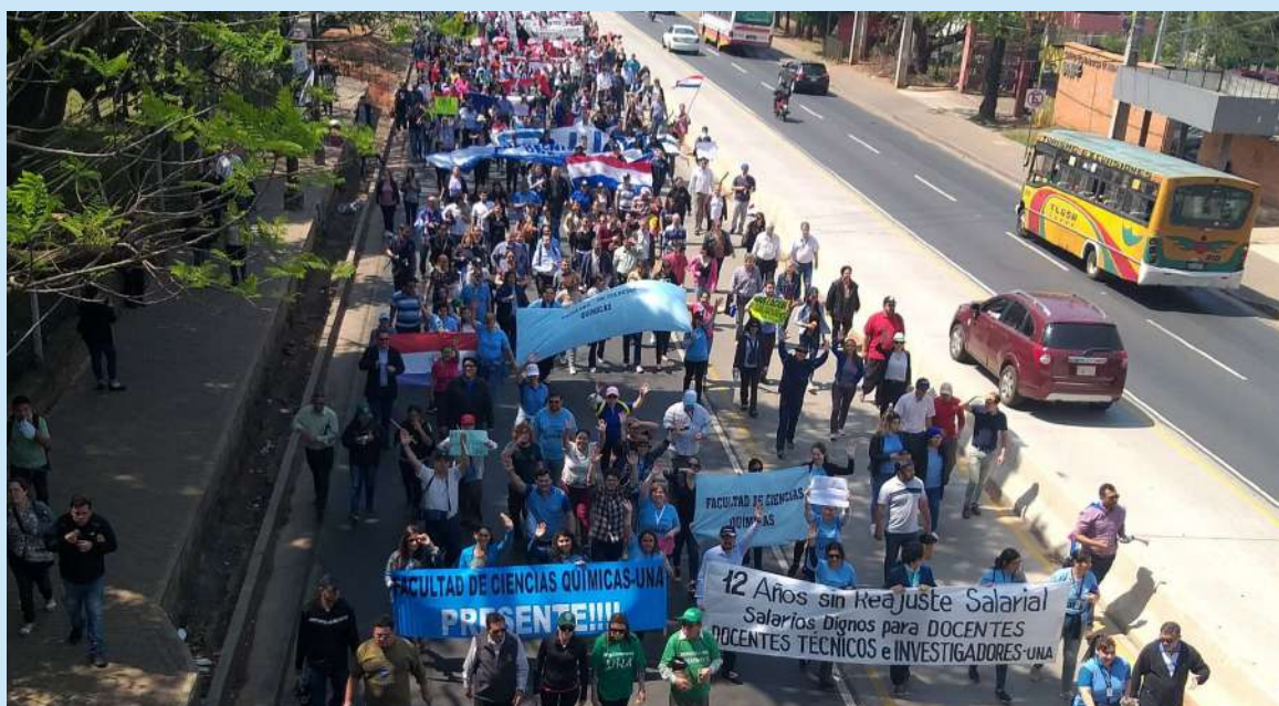
Movilización sobre la Ruta Mcal. Estigarribia