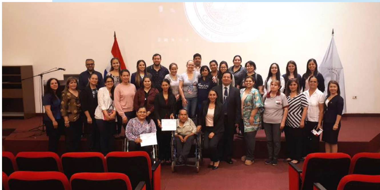
Participantes y disertantes de la Semana "Universidad Inclusiva"

Los días 5 y 6 de diciembre, se ha realizado la Semana "Universidad Inclusiva", en conmemoración al Día Internacional de las Personas con Discapacidad, en el Salón Auditorio de la Facultad de Ciencias Químicas - UNA