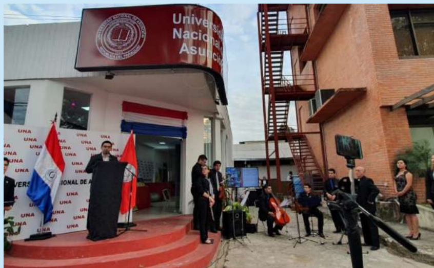
Acto Inaugural del Stand de la UNA en la Expo 2019

En esta edición, la FCQ presentó su stand a través de la Dirección de Extensión Universitaria y Prestación de Servicios, que dio a conocer las investigaciones y experimentos realizados por los estudiantes, además de promocionar las carreras que ofrece la casa de estudios y brindar información sobre los servicios ofrecidos por los laboratorios y los cursos dictados en la Institución.