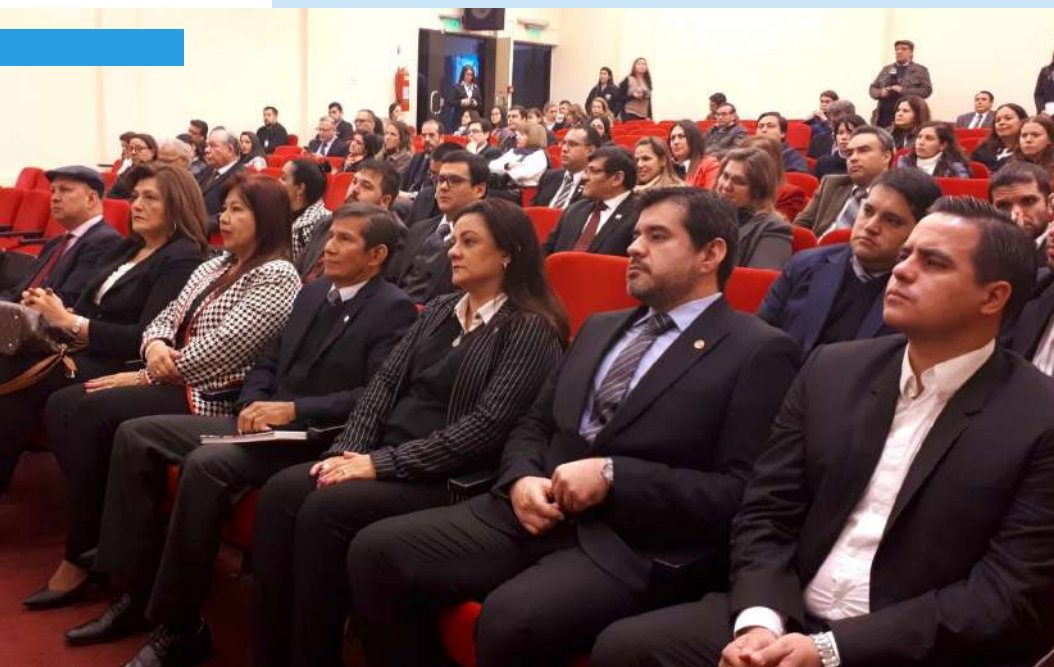
Acto Inaugural de las XIII Jornadas de Jóvenes Investigadores de la UNA