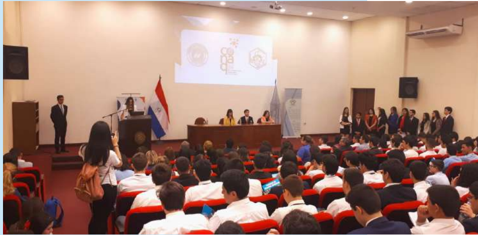
Acto de inauguración de las CONAQ 2019

Organizada por el Centro de Estudiantes de Química y con el apoyo de la Facultad de Ciencias Químicas y la Universidad Nacional de Asunción, en el espacio de dos días, se desarrollaron las competencias en diferentes categorías como: pruebas escritas, defensa oral de conocimientos y pruebas de laboratorio; donde los alumnos participantes demostraron sus conocimientos en el área de química.