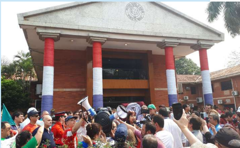
Convocatoria frente al Rectorado de la Universidad Nacional de Asunción

Desde el 14 al 30 de septiembre, la Universidad Nacional de Asunción, junto con todas sus Unidades Académicas, declararon el paro total de actividades académicas y administrativas como medida de protesta ante el Ministerio de Hacienda para una mayor asignación presupuestaria y reivindicaciones salariales para sus docentes.