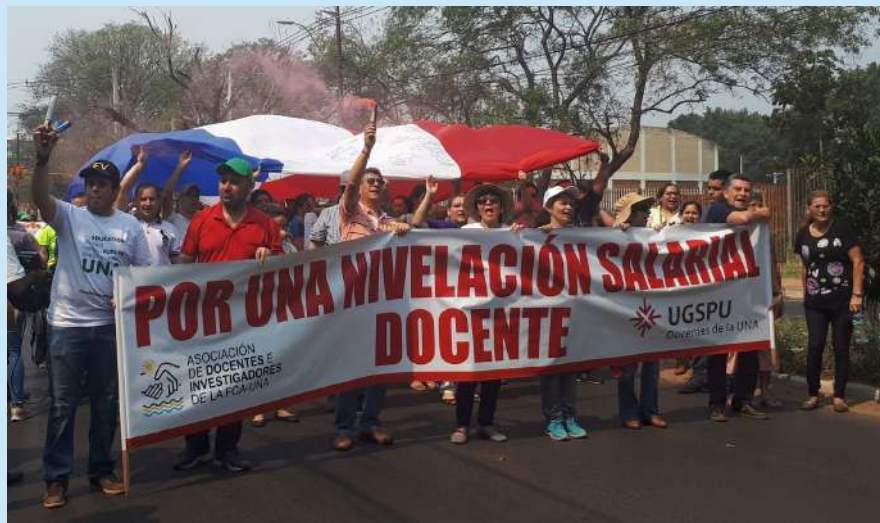
Movilización sobre la Av Mcal. López

La medida fue decidida tras concretar el acuerdo con el Ministerio de Hacienda, que remitió el pedido de reprogramación presupuestaria, contemplando la nivelación salarial docente. De esta manera concluyó el paro total y los docentes recibirán la nivelación salarial en dos etapas.