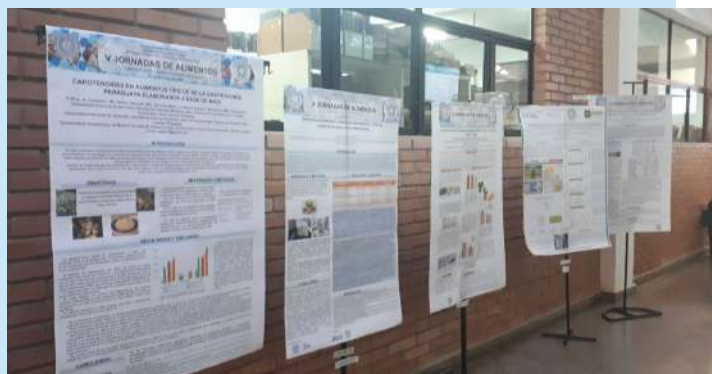
Presentación de los trabajos de investigación

El evento, organizado por la Dirección de Postgrado y la Dirección de Investigaciones de la FCQ, que fue declarado de interés institucional, tuvo la participación de numerosos conferencistas y se premió a los mejores trabajos de investigación sobre granos y legumbres, presentados a través de posters por los participantes inscriptos.