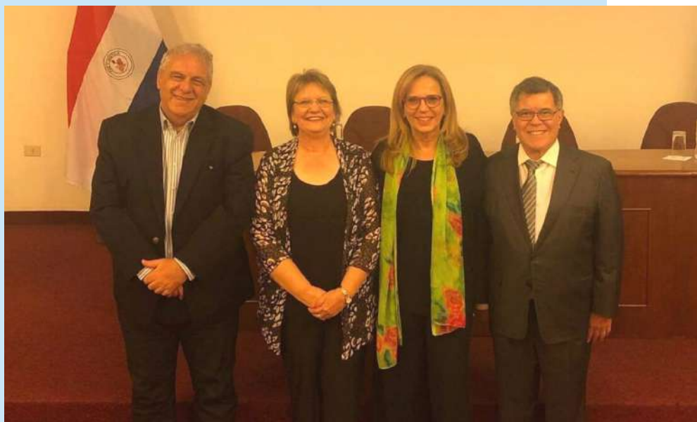
Miembros de la Academia de Ciencias Farmacéuticas del Paraguay