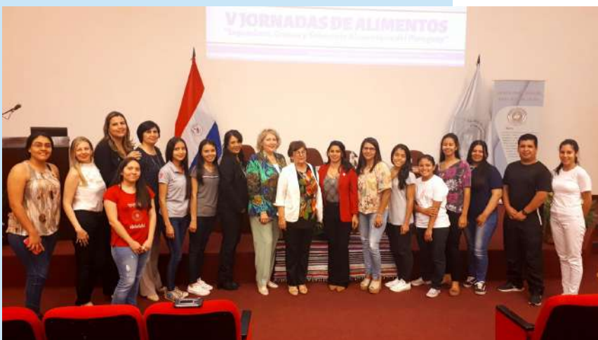
Disertantes y participantes de las V Jornadas de Alimentos