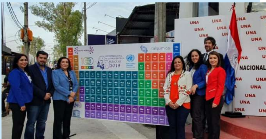
Acto Inaugural del Stand de la UNA en la Expo 2019

En la ocasión además, se dio la inauguración oficial del Stand en la Expo 2019 de la Universidad Nacional de Asunción, Se trata de la primera edición de esta feria del trabajo en la cual la casa de estudios universitarios más antigua del país, marca presencia con todas sus Unidades Académicas.