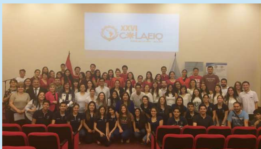
Lanzamiento "XXVI COLAEIQ Paraguay 2020"

Culminada la entrega de certificados, miembros de la Comisión Organizadora del Congreso Latinoamericano de Estudiantes de Ingeniería Química presentaron el XXVI COLAEIQ 2020, donde Paraguay será por primera vez la sede de un evento de tal magnitud.