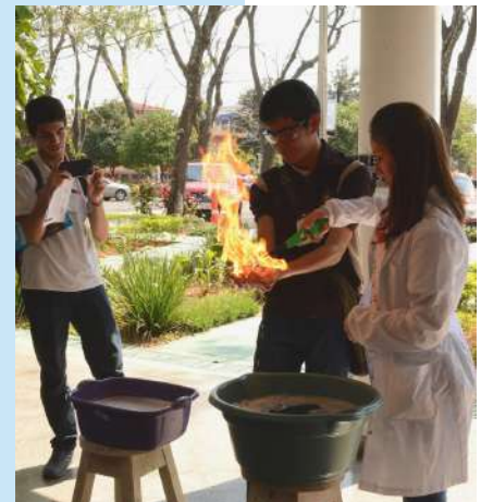
Los alumnos de la FCQ realizaron experimentos y compartieron sus conocimientos con los participantes de las CoNaQ 2019