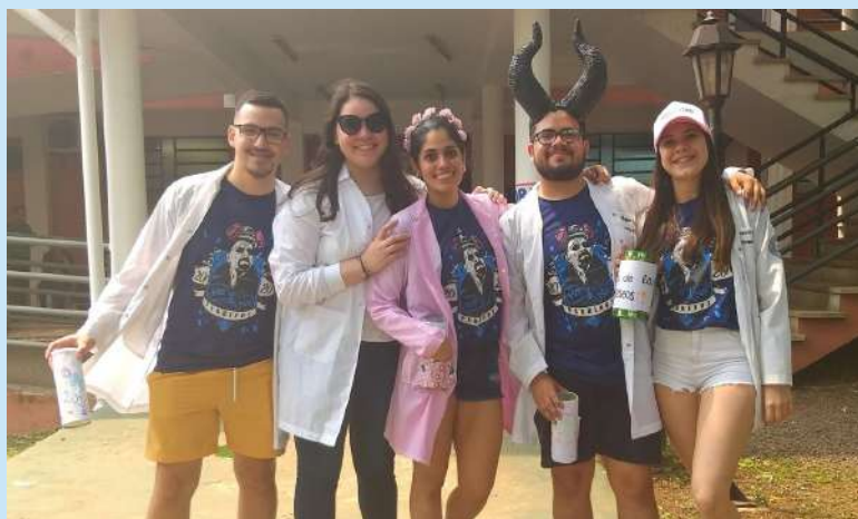
Padrinos de los postulantes