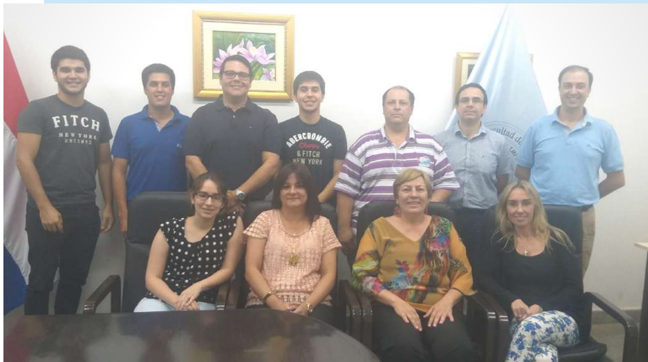
Integrantes del Consejo Directivo

El Tribunal Electoral Independiente (TEI) de la Facultad de Ciencias Químicas - UNA proclamó a los nuevos integrantes del Consejo Directivo para el periodo 2019 - 2022, luego de las elecciones de Estamentos Docentes y Graduados realizado el miércoles 16 de octubre.