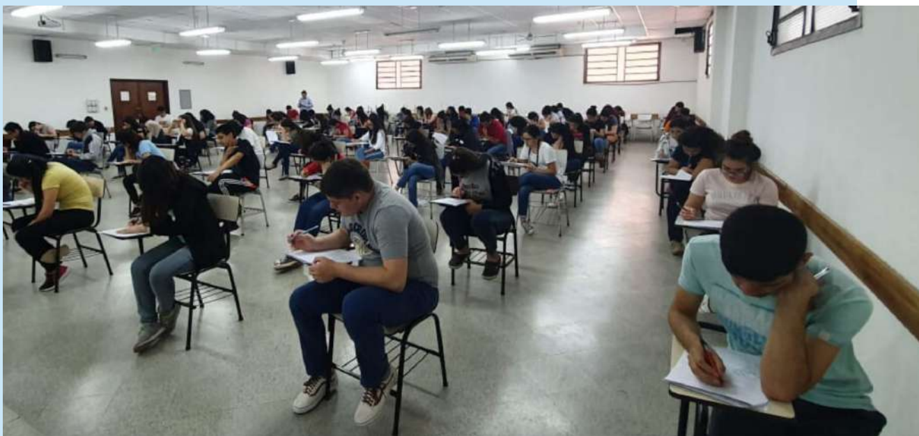
Examen de Biología General, Admisión a la FCQ

El siguiente llamado se realizará en enero de 2020.