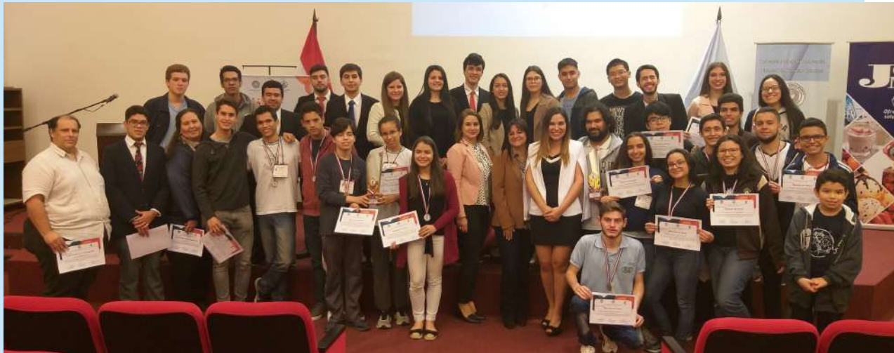
Ceremonia de premiación a los alumnos con las mejores calificaciones