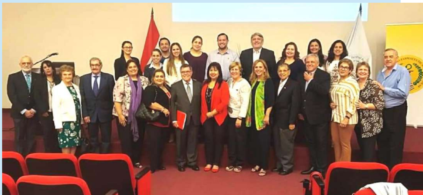
Miembros de la Academia de Ciencias Farmacéuticas del Paraguay

Ciclo de Conferencias en conmemoración a los 12 años de fundación de la Academia de Ciencias Farmacéuticas del Paraguay