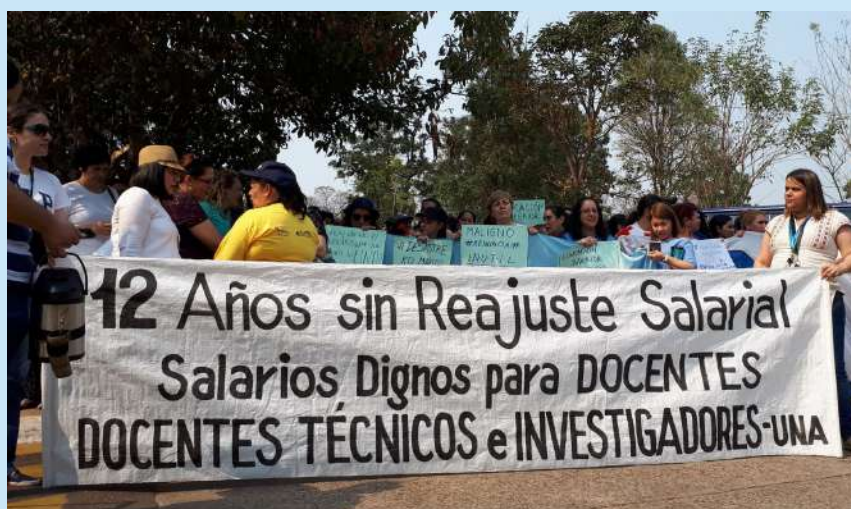
Convocatoria frente al Rectorado de la UNA

Las medidas de protesta incluyeron movilizaciones diarias de docentes, funcionarios y estudiantes, por la Ruta Mcal. Estigarribia, la Avenida Mcal López y en las inmediaciones del Ministerio de Hacienda, en el microcentro de la ciudad de Asunción. La nivelación salarial docente ha venido siendo postergada por unos doce años.