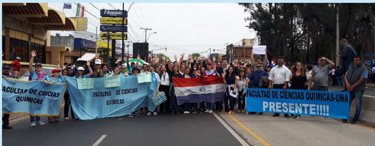
La Facultad de Ciencias Químicas presente en las movilizaciones

Las medidas de protesta incluyeron movilizaciones diarias de docentes, funcionarios y estudiantes, por la Ruta Mcal. Estigarribia, la Avenida Mcal López y en las inmediaciones del Ministerio de Hacienda, en el microcentro de la ciudad de Asunción. La nivelación salarial docente ha venido siendo postergada por unos doce años.