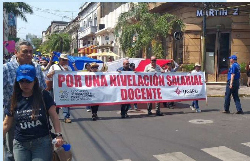
Movilización en el microcentro de Asunción

La medida fue decidida tras concretar el acuerdo con el Ministerio de Hacienda, que remitió el pedido de reprogramación presupuestaria, contemplando la nivelación salarial docente. De esta manera concluyó el paro total y los docentes recibirán la nivelación salarial en dos etapas.