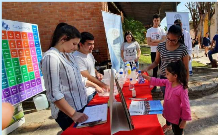
Los alumnos de la FCQ atendiendo al público

Estuvieron presentes grupos de estudiantes de la Facultad de Ciencias Químicas que conforman el equipo de las Competencias Nacionales de Química (CoNaQ) realizando experimentos; y la Asociación Paraguaya de Estudiantes de Nutrición (APEN-UNA), trabajando en conjunto con el Consultorio Nutricional de la Facultad de Ciencias Químicas.